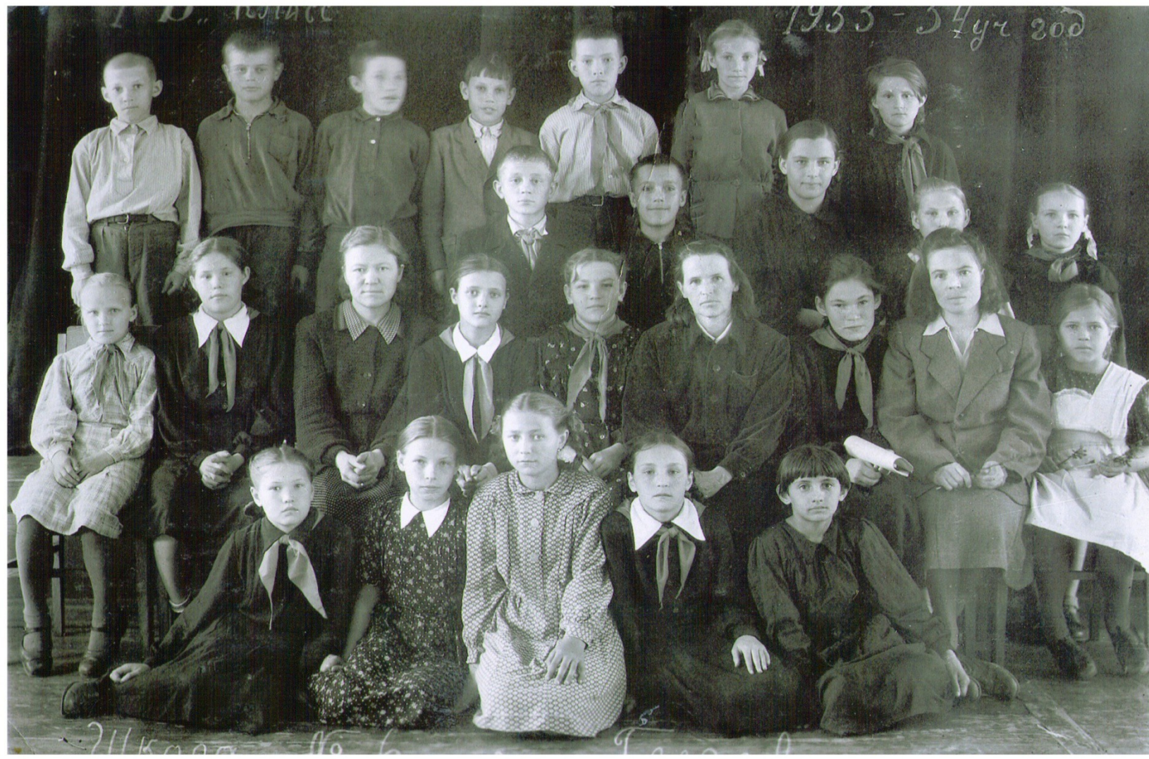
Ученики 1953-1954 учебного года, среди которых половина - немцы