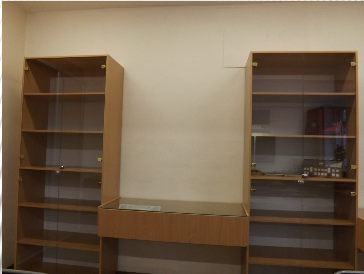
Музейная комната гимназии №6. Стеллажи для экспонатов будущей